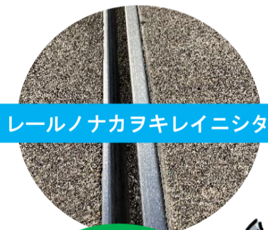
レールノナカラキレイニシタ