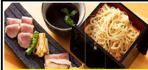
写真撮り忘れ→ネットから拝借