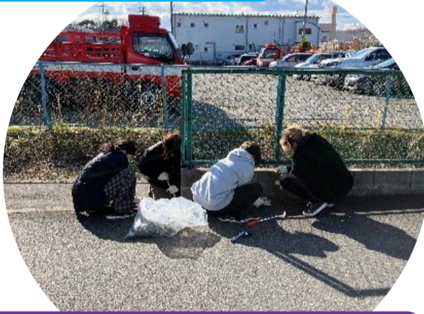
雪の前日(笑) 天気は良かったけど風もあり寒空の下、おつかれさまでした